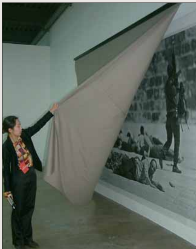
GUSTAV METZGER, To Walk Into – Massacre on the Mount, Jerusalem, 8. November 1990, Historische Fotografie, Vorhang, 1996. The 8th Gwangju Biennale 2010.