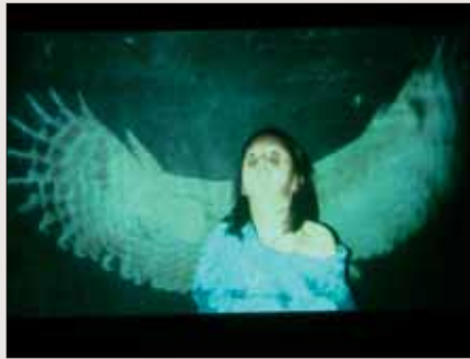
SUANG HWAN KIM, Washing Brain and Corn, Video, 2010. Media City Seoul, Biennale 2010