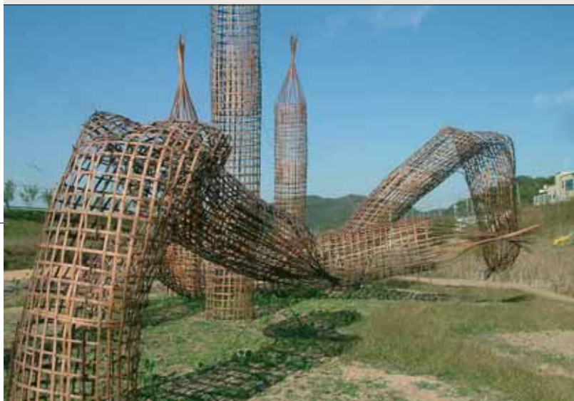
EUNGWOO RI, A Sprout – A Great Dream, Bambus, Stahl, 2009/2010. Gongju, Geumgang-Naturkunstbiennale 2010. unten:SUZY SURECK, Lotus Pedals, Holz, Spiegelfolie, 2009/2010. Gongju, Geumgang-Naturkunstbiennale 2010.