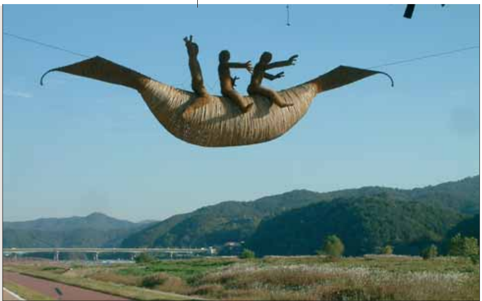
ROGER TIBON, Peace Boat, Bambus, Metall, 2009/2010. Gongju, Geumgang-Naturkunstbiennale 2010.

der Natur, deren Klang man symbolisch auch durch die große Muschel aus Hanfgeflecht der Niederländerin Karin van der Molen lauschen kann. Unterdessen reflektiert der Neuseeländer Donald Buglass mit einer hölzernen Halbkugel-Form die traditionellen Grabhügel, die auf fast jedem koreanischen Berg anzutreffen sind. Spannend ist auch die Begegnung mit den älteren Arbeiten der Biennalen von 2006 und 2008, etwa mit den künstlichen Felsen aus Zeitungspapier des Amerikaners Steven Siegel, die mit jedem Jahr mehr von der Natur integriert werden. Romantisierend und damit iro-