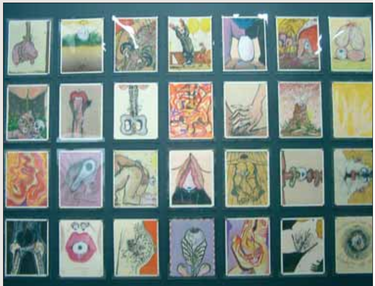
JAKUB ZIOLKOWSKI, History of the Eye, 69 Arbeiten Öl/Papier, 2010. The 8th Gwangju Biennale 2010.