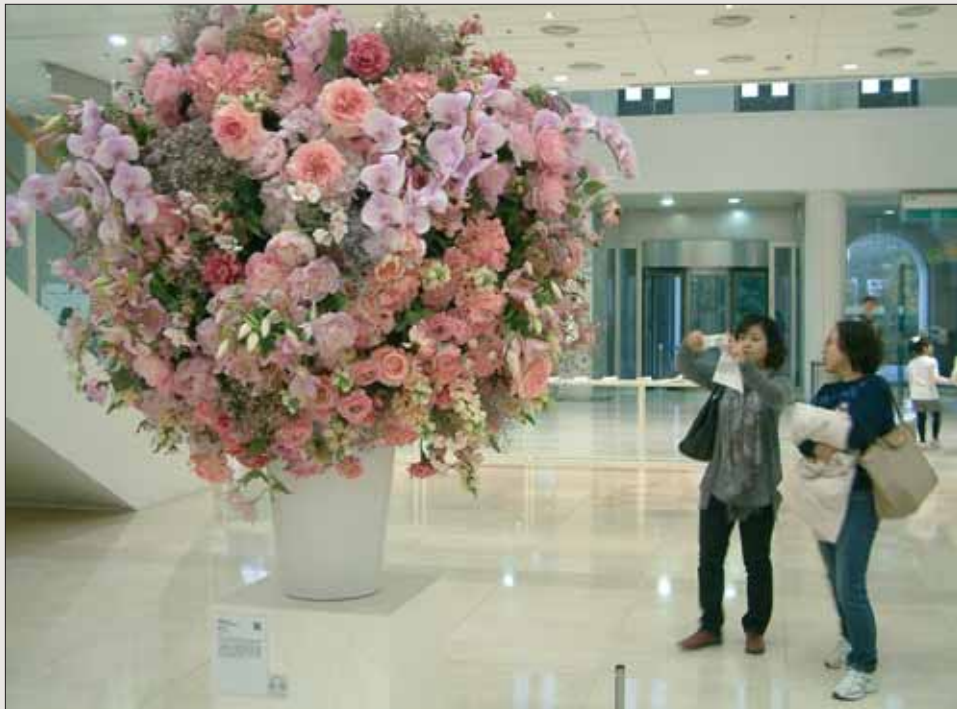
WILLEM DE ROOIJ, Bouquet VII, Installation mit echten und künstlichen Blumen. Media City Seoul, Biennale 2010.

» Eine Reise zur Kunst in Seoul, Gwangju, Busan und Gongju«