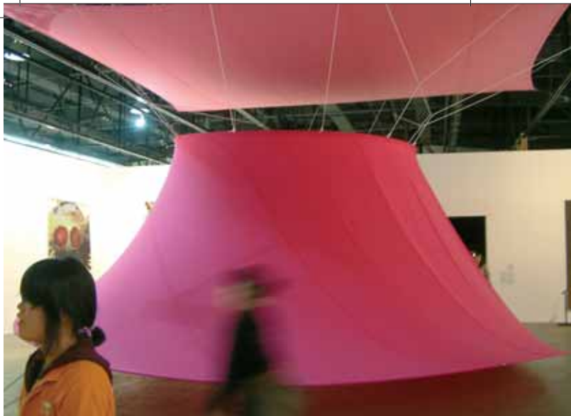
RUPPRECHT GEIGER, Rote Trombe, Nylon, 1985. The 8th Gwangju Biennale 2010.