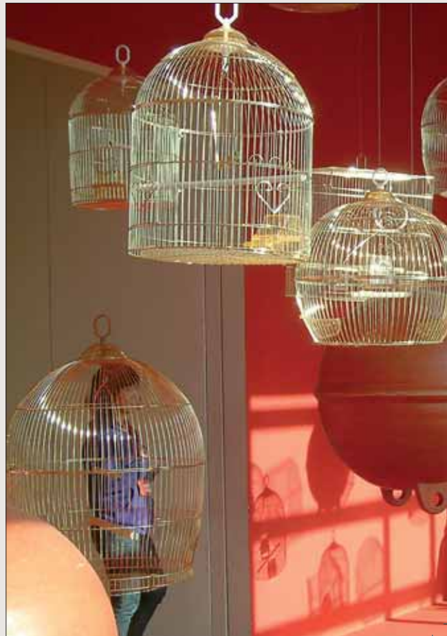
TAE-HUN KANG, Kein Vogel singt mehr, Mixed Media, 2010 . Busan-Biennale 2010