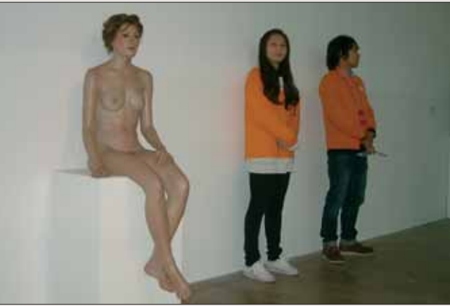
JOHN DE ANDREA, Katy, Vinyl, 1991. The 8th Gwangju Biennale 2010.