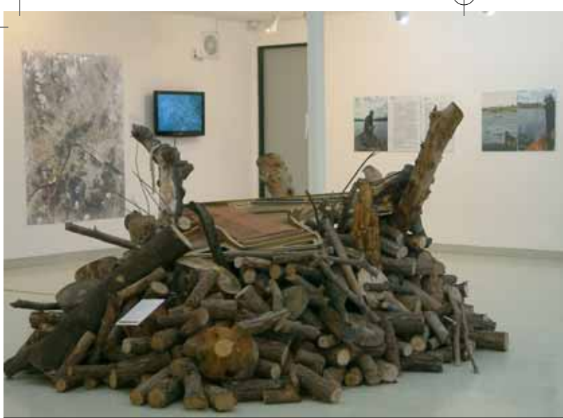
MIAE SONG, Forgiven all too soon, Klavierteil, Holz, Ton. Neue Galerie – Geumgang International Nature Art Center, Gongju, Geumgang-Naturkunstbiennale 2010.