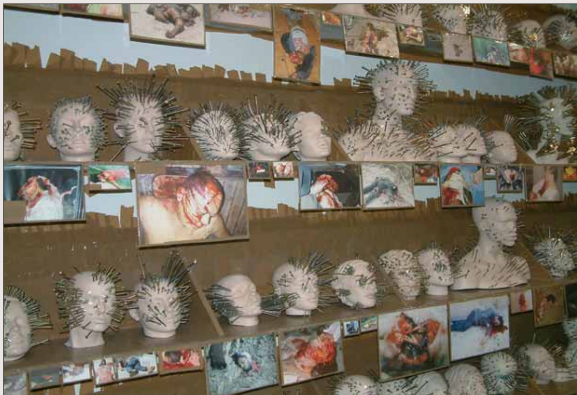
THOMAS HIRSCHHORN, Embodied Fetish, Installation, Mixed media, 2006. The 8th Gwangju Biennale 2010.