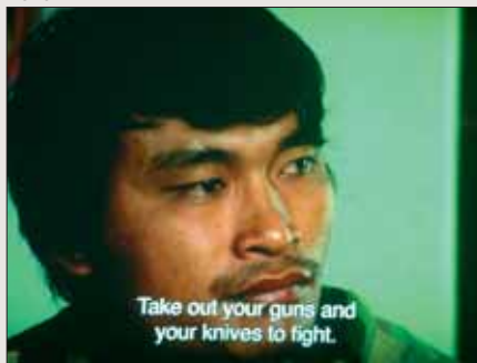
APICHATPONG WEERASETHAKUL, Nabua, Video-Installation, 2009; unten: YAEL BARTANA, Mary Koszmary (Nightmare), Video- und Objekt-Installation, 2007. Media City Seoul, Biennale 2010.