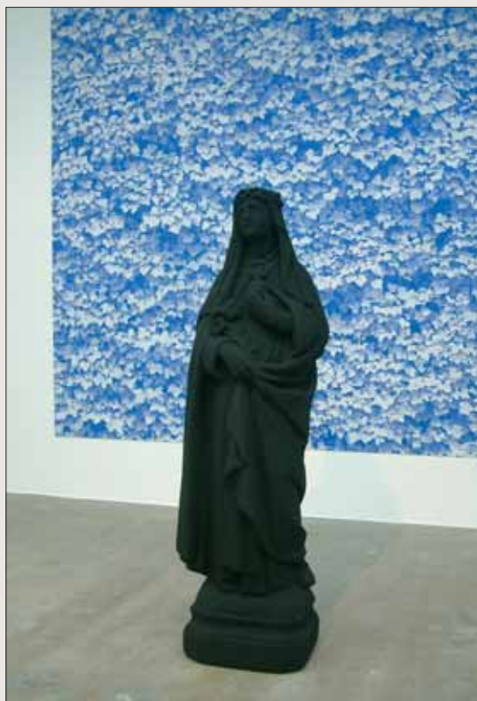
KATHARINA FRITSCH, St. Katharina, Photograph 2 (Ivy), Installation, 2007. The 8th Gwangju Biennale 2010.