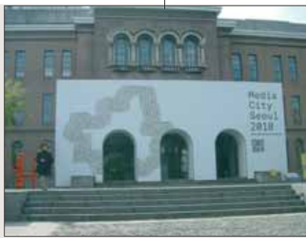
Seoul Museum of Art, Media City Seoul, Biennale 2010

Wer das Museum of Art als Hauptgebäude betritt, wird von einer freundlichen Koreanerin persönlich in englischer Sprache begrüßt: Jeden Tag mit einer wechselnden aktuellen Überschrift aus einer Tageszeitung - ein Projekt des deutsch-britischen Künstlers Tino Sehgal, das den Besucher ebenso zusammenhanglos überfällt, wie die täglichen Nachrichten unserer Medien. Aber was ist wahr daran? Beschreiben Worte und Bilder das, was wirklich ist? Solche Fragen werden gleich anschließend im Foyer durch den Niederländer Willem de Rooij