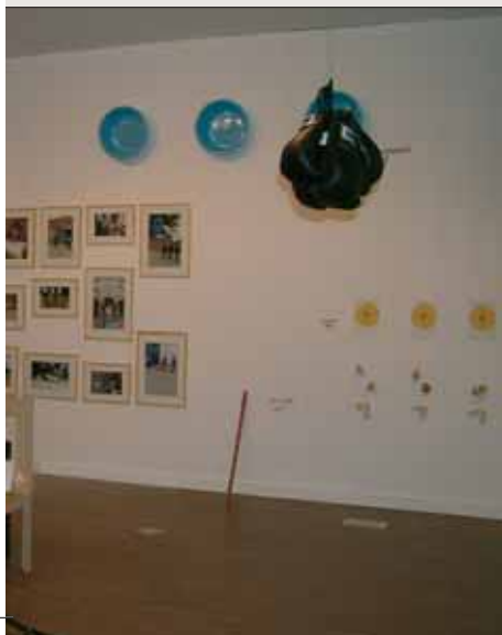
I OZAWA, Gemeinschaftsprojekt XIJING MEN, Mixed le 2010.