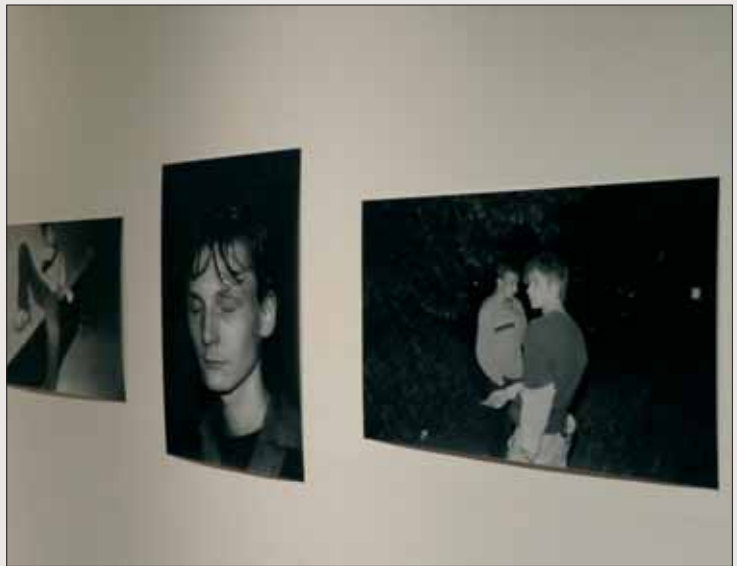
TOBIAS ZIELONY, Big Sexyland, C-Print, 2006. Media City Seoul, Biennale 2010 unten: JEWYU RHIL, Lie on the Han River, Installation, Video, 2005/2010. Media City Seoul, Biennale 2010.