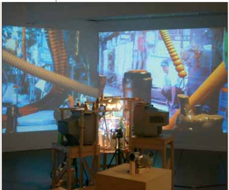
TARO IZUMI, Fish-Bone-Hanger, Video, Installation, 2009. Media City Seoul, Biennale 2010.

In Koreas erster Mädchenschule von 1915, der heutigen Simpson Memorial Hall unweit des Museums, hat der Koreaner Duck Hyun Cho im gesamten Gebäude sein „Herstory Museum Project“ zur Hinterfragung der Rolle der Frauen in der koreanischen Geschichte eingerichtet: Historische Fotos, Erinnerungen in den Stimmen von 100 Frauen sowie ein Archiv mit verpackten Objekten bilden eine Mischung aus Dokumentation und poetischer Installation. Unterdessen hat die in Paris lebende Koreanerin Kim Soun Gui vor dem nahegelegenen Historischen Museum von Seoul eine versiegte Jahrhunderte alte Quelle mittels Toncollagen zu neuem Leben erweckt: mit Wassergläschen oder Frauenstimmen, denn einst waren Quellen mediale Orte, an denen Wissen und Neuigkeiten weitergegeben wurden.