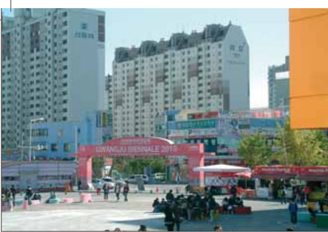
Gwangju-Biennale 2010, Tor. The 8th Gwangju Biennale 2010.