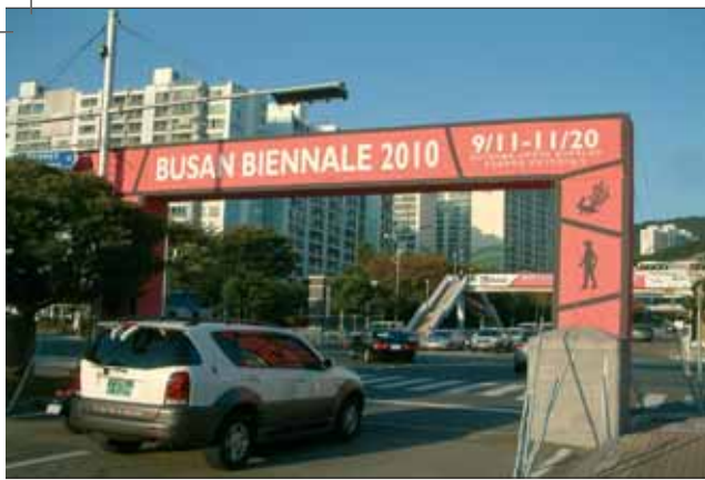
Busan-Biennale 2010, Tor am Yachthafen