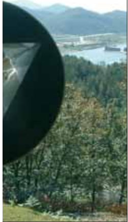
stahl, Spiegel. Gongju, Geum-