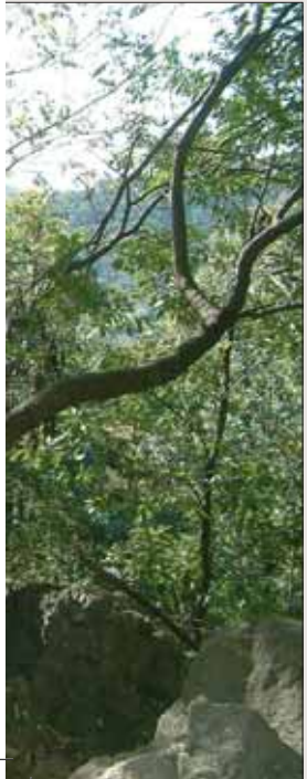
KANG HUR, Legend of a Bear-Duality, Stahl, 2010. Gongju, Geumgang-Naturkunstbiennale 2010.