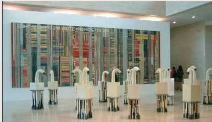
SHANGHO SHIN, Structure & Force-ID, glasierte Keramik, 2004, Language Series, glasierte Keramik, Wandobjekt, 2008. Busan-Biennale 2010.