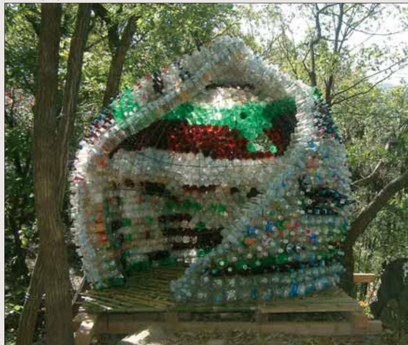
NEREUS PATRIK CHEO, The Watchtower Kiosk, gebrauchte Kunststoff-Wasserflaschen, Draht, Bambu, Geumgang-Naturkunstbiennale 2010.

Im Bergwald des Yeonmisan verbreiten geometrische Spiegelobjekte des Koreaners Chungwon Cho ein flirrendes Bild von der Schönheit